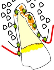
Figura 2. Acúmulo de placa, penetração das bactérias e alteração dos tecidos periodontais