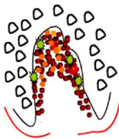
Figura 3. Perda dentária