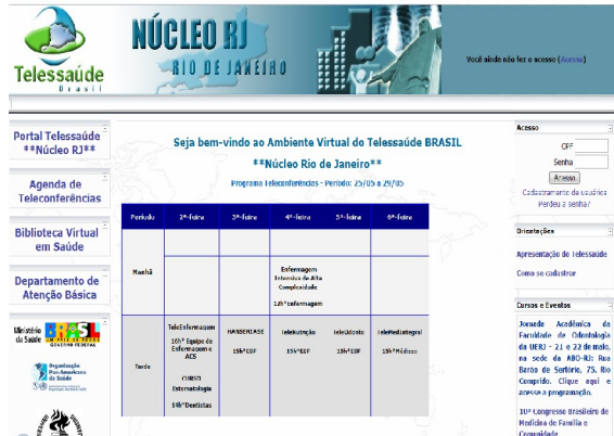
Figura 1: Página do AVA