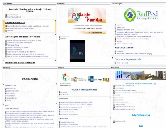
Figura 3: Espaços com cadastro e de temática específicas