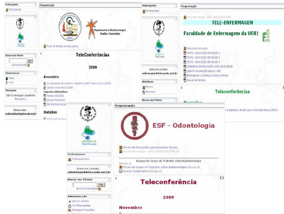
Figura 2: Comunidades Restritas